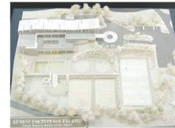
현상설계모형 Detail · Creative · Quality - MODELING GROUP INO