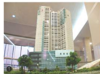
주상복합·오피스텔 모형 Detail · Creative · Quality - MODELING GROUP INO