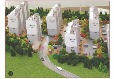
아파트모형 Detail · Creative · Quality - MODELING GROUP INO