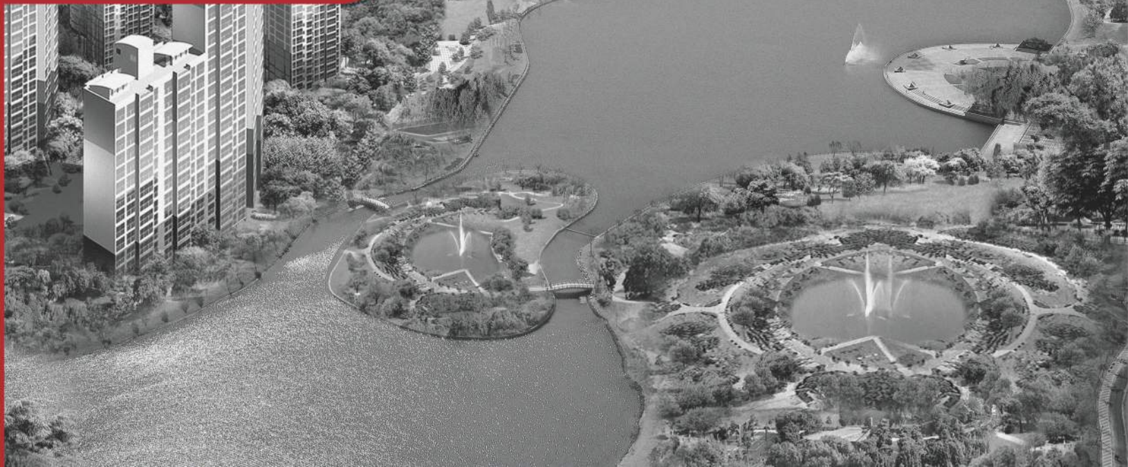
위치도 모형 Detail · Creative · Quality - MODELING GROUP INO

단지모형을 확대하여 분양현장의 위치를 손쉽게 알아 볼 수 있도록 부각시키고, 주요도로망과 관공서, 학교, 병원, 문화시설 등 주변 환경 등의 정보를 제공 함으로써 홍보 및 마케팅 효과를 극대화합니다.